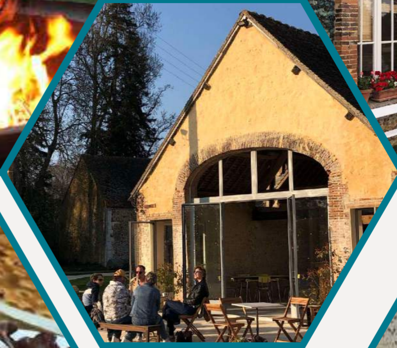
LE GRAND SALON